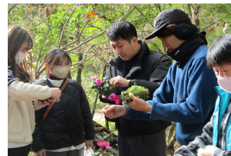
なかなかの出来じゃね