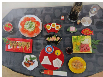
おいしそうに完成です