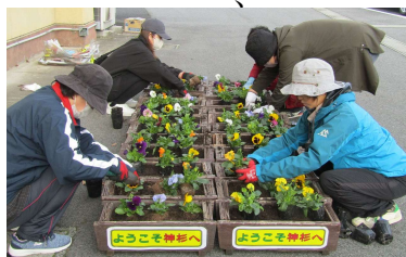
「ようこそ神杉へ」のプランターへ

これから年末年始に向かい、慌ただしい日が続きますが、皆さんの心がけひとつで防犯対策はできます。犯罪のない神杉にしましょう。