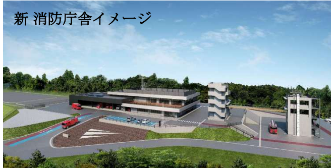
新 消防庁舎イメージ

そして、市長さんについて講座生からも少し質問をしました。印象に残っているのは、座右の銘で『温故知新』だそうです。市長さんには、これからも体調に充分気を付けられて、しっかりと三次市民をリードし、前進していただきたいと思えます。