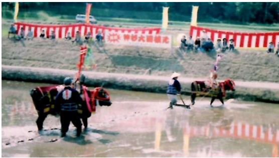
第1回は広～い圃場へ花牛2頭でした