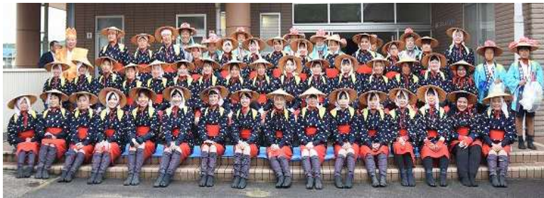
昨年の早乙女・サゲ衆全員集合