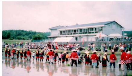
圃場全面を使って 端から端まで

神杉地区 自治会連合会 TEL 66-1323 2025/2/10 発行 1月末(前月比) 人口 1,465(-4) 世帯 604(+2) ホームページ kamisugi@city.jp