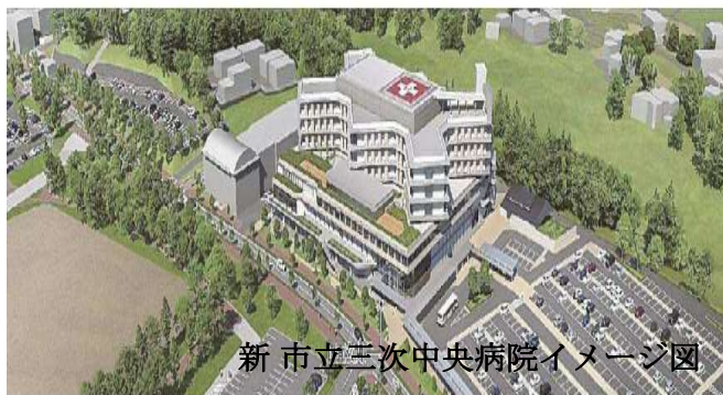
新 市立三次中央病院イメージ図