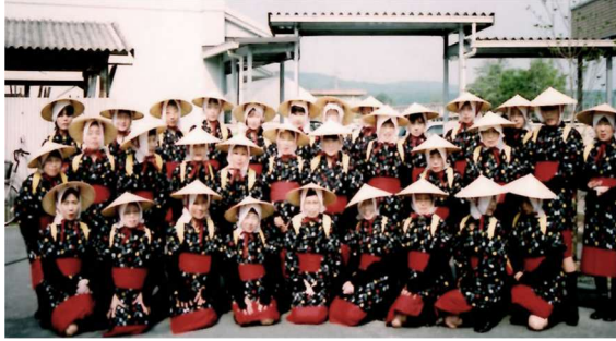
初代早乙女さんたち