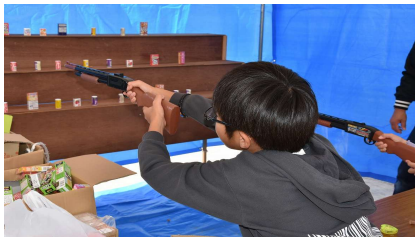
昨年度 フードコーナー・遊びコーナー