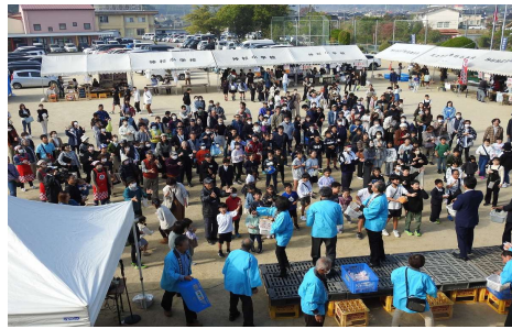
昨年度 福餅まき風景

8月22日(木) 第31回神杉ふれあい祭りの1回目の実行委員会を開き、11月3日(日) 午前8時30分開始を決定しました。本年度は、神杉小学校創立150周年を記念して、小学校児童の皆さんの学習発表会と記念式典など、お祝い行事を取り入れる予定です。(敬称略)