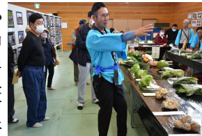
昨年度 農産物競り市

午前には体育館で児童の鼓笛演奏、神杉小学校創立記念150周年記念式典、小学校児童学習発表会、記念講演など。