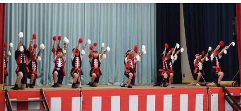
昨年度 芸能発表会

神杉地区 自治会連合会 TEL 66-1323 2024/9/10 発行 8月末(前月比) 人口 1,483(-4) 世帯 606(±0) ホームページ kamisugi@m-city.jp